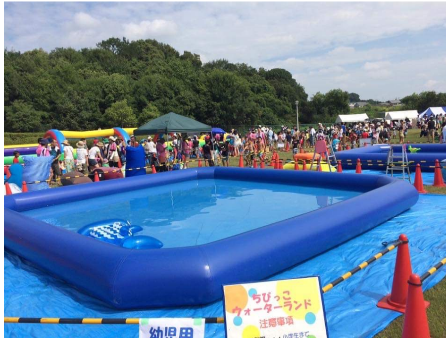
KISHIWADA ウォーターフェス2017 開催風景