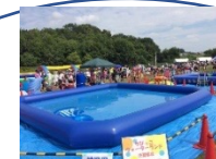
幼児遊具スペース