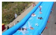
手作りスライダー・幼児遊具スペース