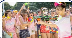
水鉄砲バトルエリア