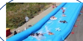
手作りスライダー