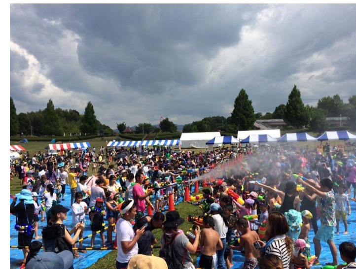
KISHIWADA ウォーターフェス2017 開催風景