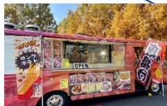
キッチンカー・屋台 (外周道路沿い)