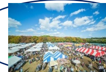
ブース設置スペース